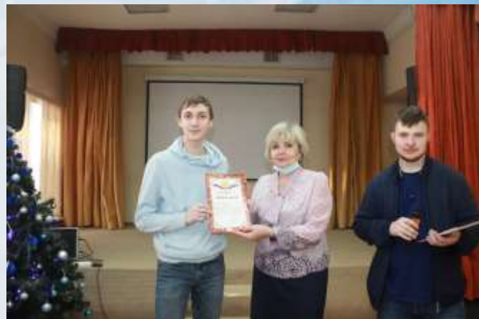
Информационные системы и программирование «Конкурс презентаций»